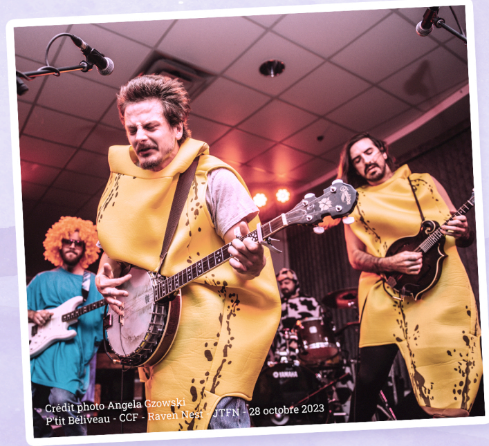
P'tit Béliveau - CCF - Raven Nest - JTFN - 28 octobre 2023