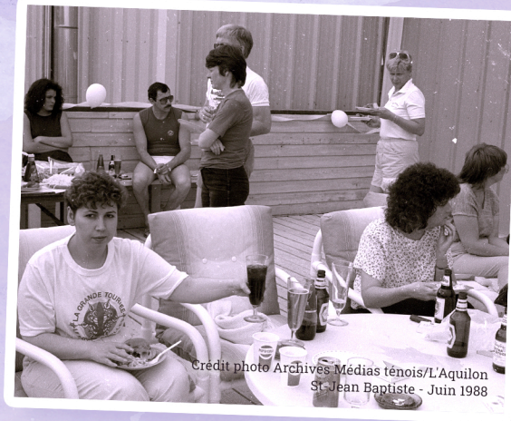
St-Jean Baptiste - Juin 1988