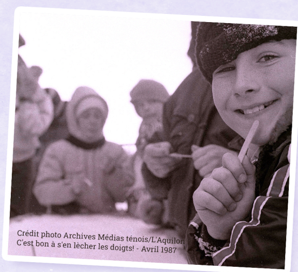
C'est bon à s'en lécher les doigts! - Avril 1987

Derrière chacune de ces initiatives, il y a eu des bénévoles qui ont donné de leur temps, de leur énergie et de leur passion. Leur contribution, souvent discrète, a pourtant été essentielle à la vitalité de la francophonie locale.