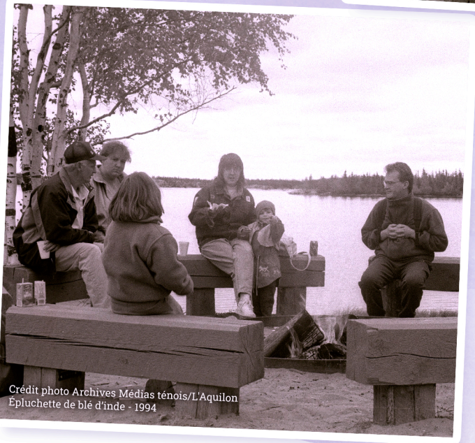
Epluchette de blé d'inde - 1994