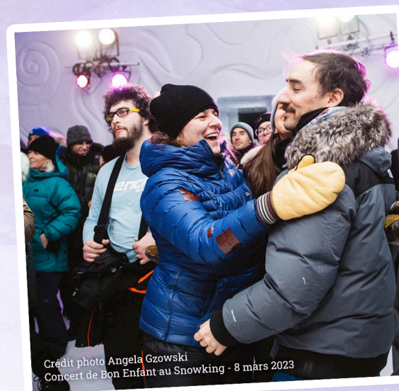
Concert de Bon Enfant au Snowking - 8 mars 2023