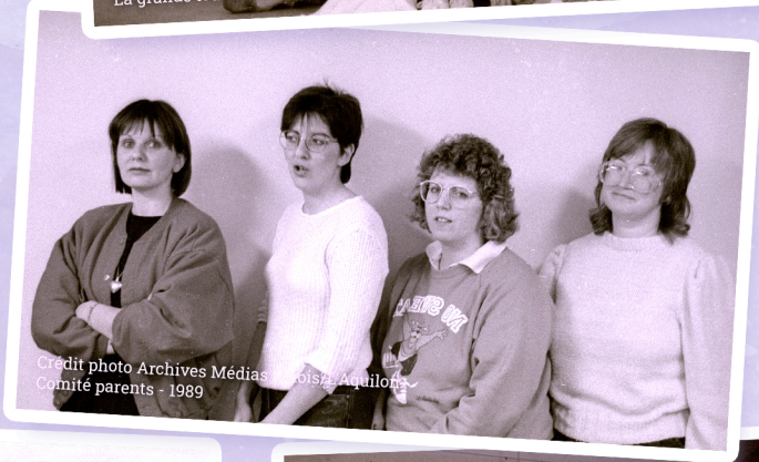
Comité parents - 1989