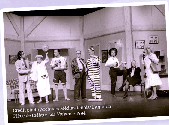
Pièce de théâtre Les Voisins - 1994

Bien qu'elle ait rapidement pris son envol, l'AFCY s'est félicitée d'avoir contribué à l'émergence des Pas Frette aux Yeux, véritable locomotive culturelle des années 1990.