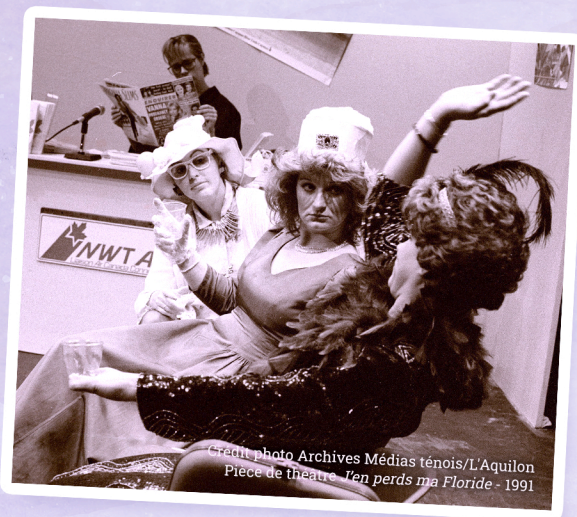
Pièce de théâtre J'en perds ma Floride - 1991

Au fil des années, la troupe se distingue dans le Nord. Elle exporte trois de ses spectacles et se produit dans divers lieux, démontrant qu'il est possible de faire vivre le théâtre communautaire en français jusque dans le Grand Nord.