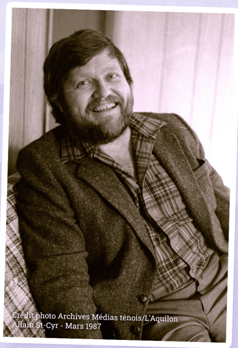
Crédit photo Archives Médias ténois/L'Aquilon Allain St-Cyr - Mars 1987