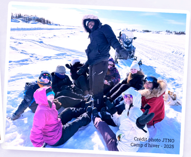
Camp d'hiver - 2025

Aux TNO, c'est sous la bannière de Jeunesse TNO que les jeunes se rassemblent pour créer, s'exprimer et vivre en français. Né du besoin de leur offrir un espace bien à eux, le mouvement a grandi avec la FFT avant de revenir, en 2021, dans le milieu associatif local grâce à une formule de gestion novatrice entre l'AFCY et l'AFTSO.