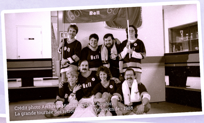
La grande tournée des retrouvailles à Yellowknife - 1988