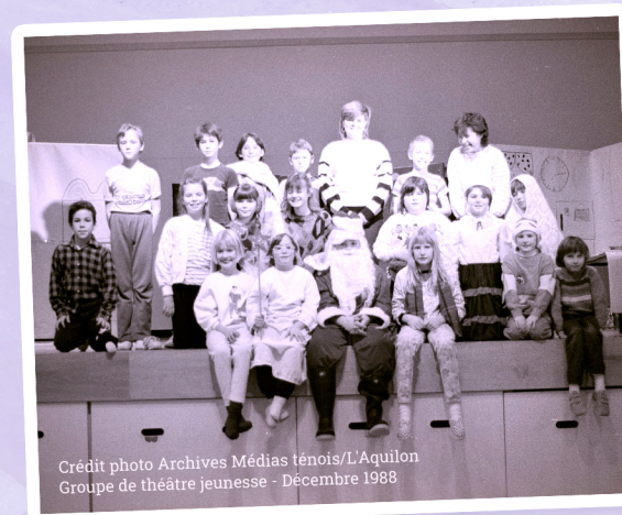
Groupe de théâtre jeunesse - Décembre 1988

Elle contribue à rendre la culture francophone vivante et accessible grâce à une programmation incluant théâtre, musique, humour, gastronomie et arts visuels. L'action de l'AFCY s'inscrit dans un mouvement collectif de développement communautaire francophone qui, avec l'engagement déterminant des parents, a mené à la création d'institutions majeures telles que l'Association des parents francophones de Yellowknife et l'École Allain St-Cyr.