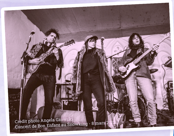
Concert de Bon Enfant au Snowking - 8 mars 2022

Constantes ou ponctuelles, parfois marquées de pauses, ces participations reflètent la volonté de la communauté francophone de prendre part à la vie collective et d'y mettre en valeur sa culture.