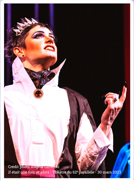
Il était une fois, et alors - Théâtre du 62 e parallèle - 30 mars 2023