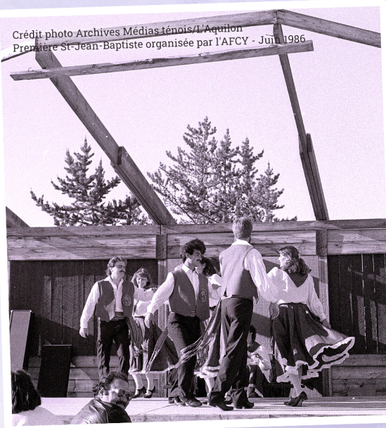
Première St-Jean-Baptiste organisée par l'AFCY - Juin 1986

Ces célébrations incarnent la joie, la solidarité et la fierté de vivre en français dans le Nord. Elles continuent, encore aujourd'hui, de rassembler petits et grands autour d'expériences festives et mémorables.