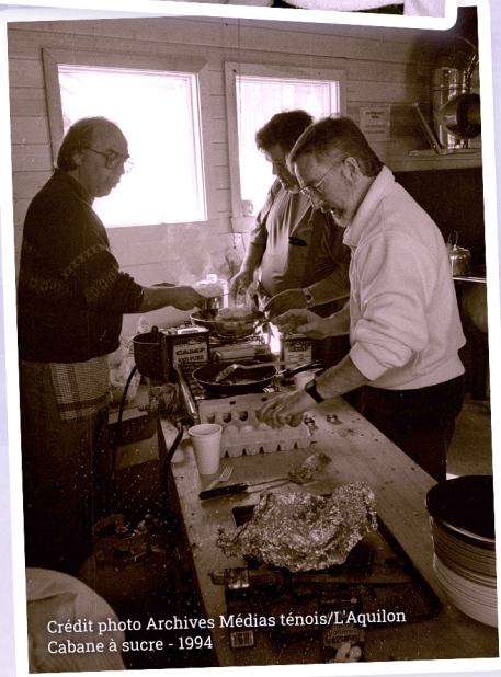
Cabane à sucre - 1994