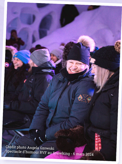
Spectacle d'humour RVF au Snowking - 6 mars 2024