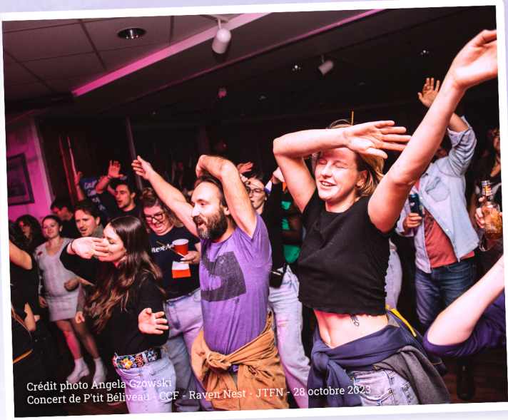
Concert de P'tit Béliveau - CCF - Raven Nest - JTFN - 28 octobre 2023